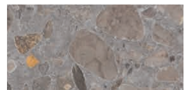
spazzolato / brushed / gebürstet