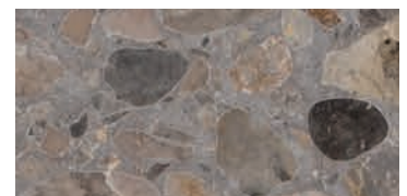
lucido / polished / poliert