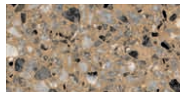
levigato / honed / geschliffen