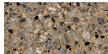
lucido / polished / poliert