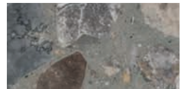
lucido / polished / poliert