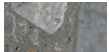
spazzolato / brushed / gebürstet