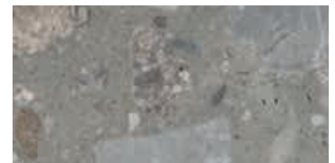
levigato / honed / geschliffen