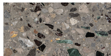
levigato / honed / geschliffen