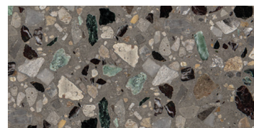
lucido / polished / poliert